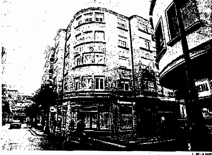
La emisora de RNE en Ponferrada tiene 53 años y es la decana de las voces radiofónicas

De hecho, ayer mismo, emisoras de la competencia de Ponferrada, como Onda Bierzo-Punto Radio, Cope y Radio Bierzo (Ser), se pronunciaron claramente a favor del mantenimiento de la radio pública en la comarca. Entre la plantilla de Ponferrada existe incertidumbre ante la situación que se vive en la radio y la televisión pública, y en particular en la emisora berciana, con relación a una posible reconstrucción de RIVE. Ante dicha incertidumbre, se requiere el reconocimiento público de las instituciones con el fin de preservar el mantenimiento de la actividad de la emisora, de sus puestos de trabajo y de su tiempo de programación, así como un plan de futuro como servicio público que es.